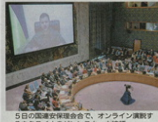
5日の国連安全保障理事会で、オンライン演説するウクライナのゼレンスキー大統領

ロシア軍による民間人殺害の報告に対し、ロシアは「フェイクニュース」として否定。中印は批判を避け、慎重な姿勢を示している。