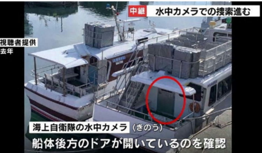
中継 水中カメラでの捜索進む 視聴者提供 去年 海上自衛隊の水中カメラ (きのう) 船体後方のドアが開いているのを確認